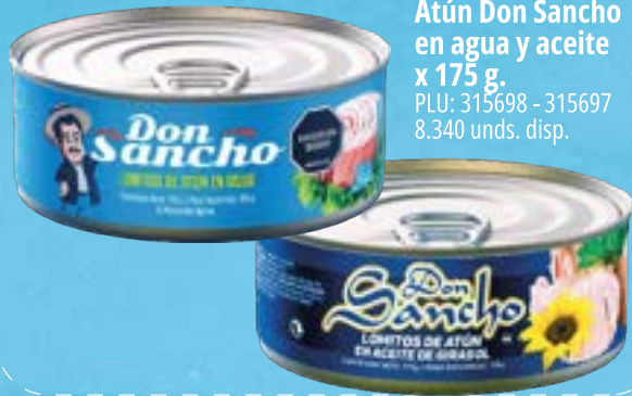
Atún Don Sancho en agua y aceite x 175 g. PLU: 315698 - 315697 8.340 unds. disp.