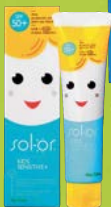
Kids Sens x 60 g. y 100 g. PLU: 310463 - 310462 NSOC09072-21CO 200 unds. disp.