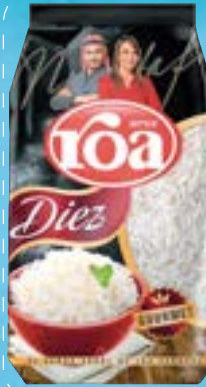
Arroz Roa 10 kg. PLU: 76944 600 unds. disp.