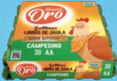
Huevos Oro AA campesino x 30 unds. PLU: 233519 - 1.800 unds. disp.