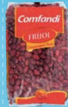
Fríjol rojo cargamanto PLU: 37819 600 unds. disp.