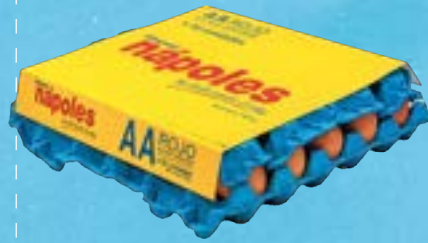
Huevos Nápoles AA rojo x 30 unds. PLU: 81897 - 1.200 unds. disp.