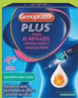
2x1 Genoprazol sachet x 10 ml. PLU: 315274 1.600 unds. disp. 2024M-0021268