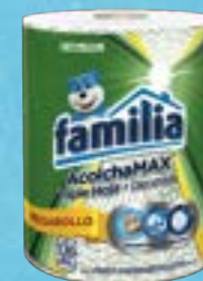
Toallas de cocina Familia ultra x 120 unds. PLU: 109514 - 786 unds. disp.