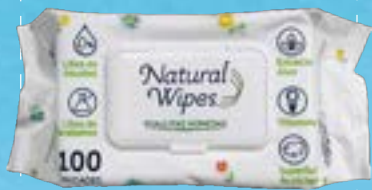
Toallitas húmedas Natural Wipes x 100 unds. PLU: 313153 - 3.350 unds. disp.