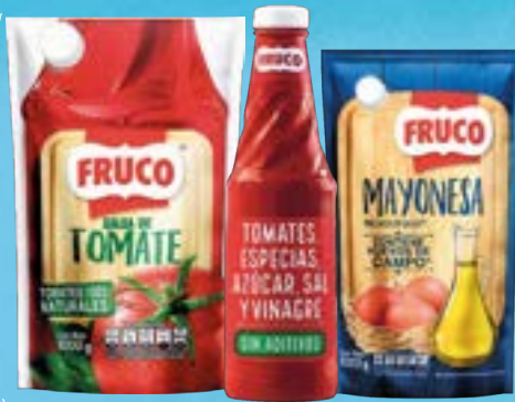
Salsa de tomate Fruco x 1.000 g. y 400 g. PLU: 281016 196755 1.400 unds. disp.