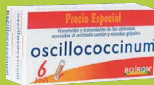
2x1 Oscilloccinum x 12 unds. PLU: 249889 - 380 unds. disp. MH2019-0000697-R1