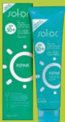
SPF 50+ x 60 g. y 100 g. PLU: 308617 - 308616 NSOC06936-21CO 400 unds. disp.