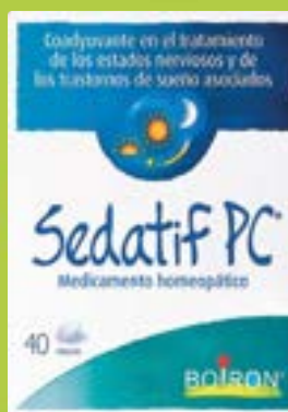
2x1 Sedatif PC tabletas x 40 unds. PLU: 85563 320 unds. disp. MH2007-0000704