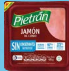
Jamón Pietrán x 431 g. PLU: 298353 - 500 unds. disp.