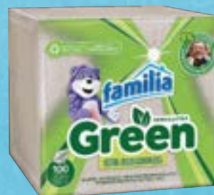
Servilletas familia green x 100 unds. PLU: 314978 - 131 unds. disp.