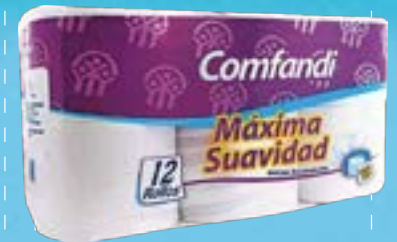
Papel higiénico comfandi 3h x 12 unds. PLU: 217229 - 6.000 unds. disp.