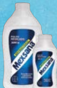
Talco Mexsana x 300 g. + 85 g. PLU: 314657 - 189 unds. disp.