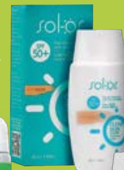
Clear Skin con color x 50 ml. PLU: 310464 NSOC10124-21CO 180 unds. disp.