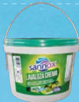
Lavalozza crema Sannox limón x 3.000 g. PLU: 314274 - 400 unds. disp.