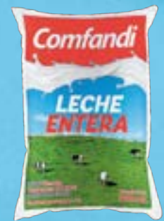
Leche entera Comfandi U.H.T. x 6 unds. x 5.400 ml. PLU: 247152 - 2.000 unds. disp.