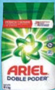
Detergente en polvo Ariel x 4.000 g. PLU: 246139 - 349 unds. disp.