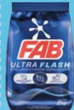
Detergente en polvo Fab Ultra Flash x 2.000 g. PLU: 313346 2.682 unds. disp.