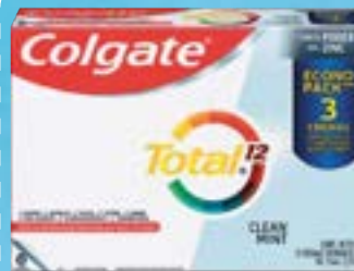
Crema dental Colgate Total x 3 unds. PLU: 199961 - 647 unds. disp.