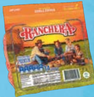
Salchicha Ranchera x 480 g. PLU: 267859 - 600 unds. disp.