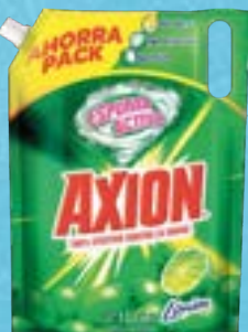
Lavaplatos Axion limón x 1.500 ml. PLU: 273475 - 210 unds. disp.